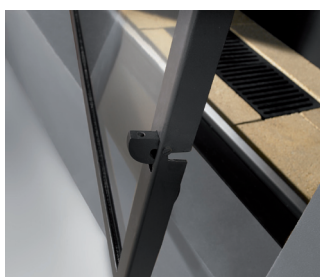
Mecanismo cierre y apertura lateral de la puerta.