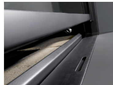
Posicionador apretura Puerta Guillotina. Control regulación Aire Primario.