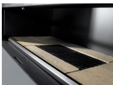
Base de material refractario resistente a 1425° C Cenicero extraíble bajo la reja.